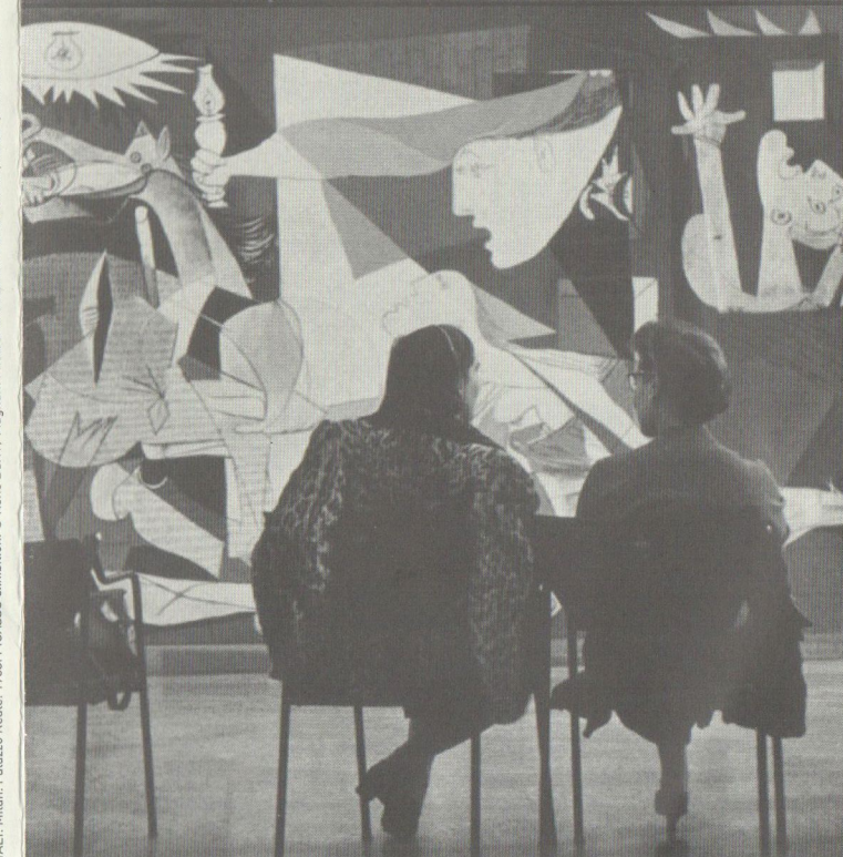
ITALY, Milán. Palazzo Reale. 1953. PICASSO exhibition. © Sucesión Pablo Picasso, VEGAP, Madrid, 2017