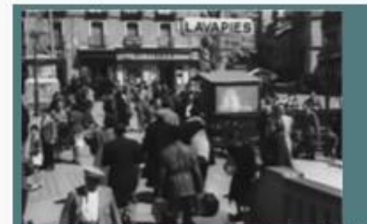
Fotograma de Surcos (1951)