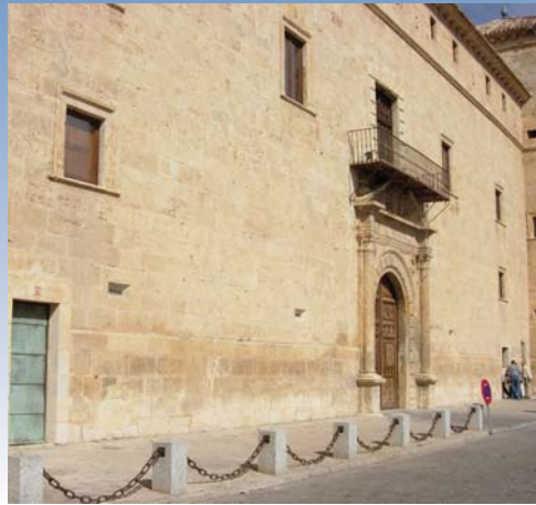
Palacio Ducal - Pastrana [Guadalupe]