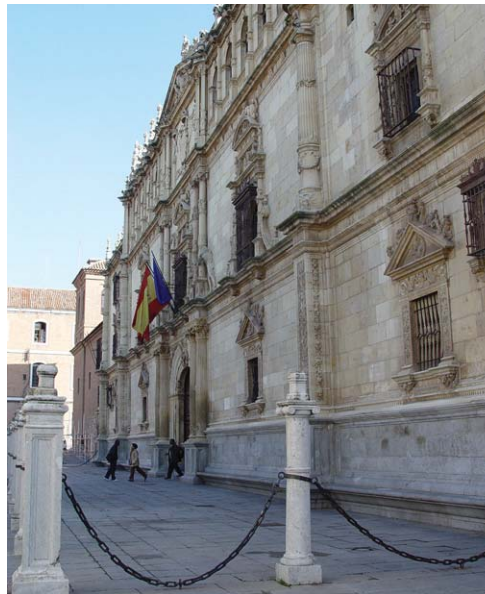
Colegio San Ildefonso - Rectorado Universidad - Alcalá de Henares [Madrid]