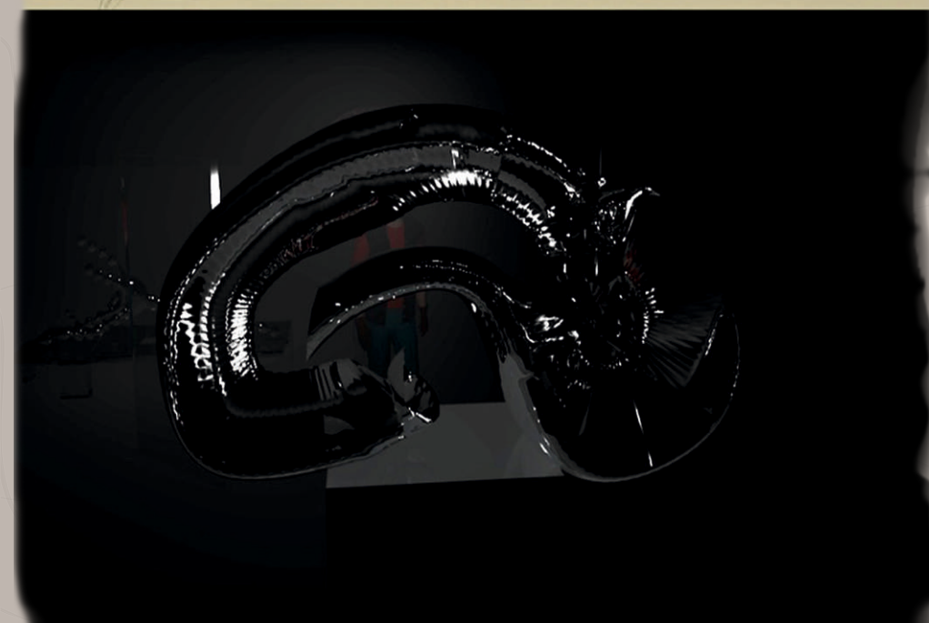
Fig 1. Ramón y Cajal, Santiago (1901) Esquema de la estructura y conexiones del hipocampo , dibujo sobre papel.