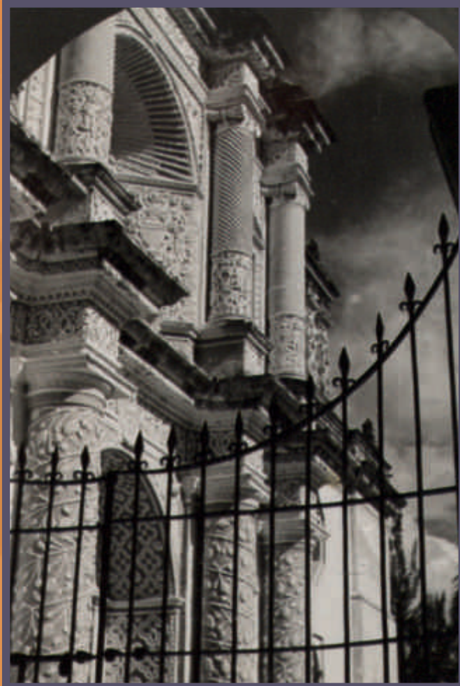
Fachada de la iglesia de Nuestra Señora de la Merced, Antigua (Guatemala) (AH4885_04, ACCHS-CSIC)