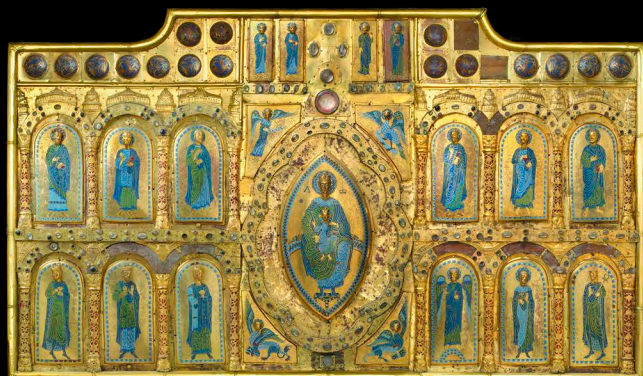
Este precioso Retablo de Laminas de meta dorada y Enmazonado con su imagen de la Virgen del sagrado de la Catedral de Pamplona, a que se agregó este mosaico de San Martín en Pamplona, con la colaboración de la Capilla de San Martín de Jaca, se terminó en Pamplona, y para que su Meta mudara a Jaca, se trasladó así en esta Capilla mayor, en el año 1763.

El curso va dirigido a todo tipo de público, desde estudiantes universitarios a entusiastas del arte románico en general.